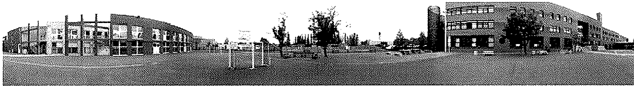
Lycée des Métiers de l'habitat et du commerce Jean-Baptiste COROT 4-6 rue Henri LEBESGUE B.P. 90681 60006 BEAUVAIS France