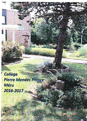
Collège Pierre Mendès France Méru 2016-2017