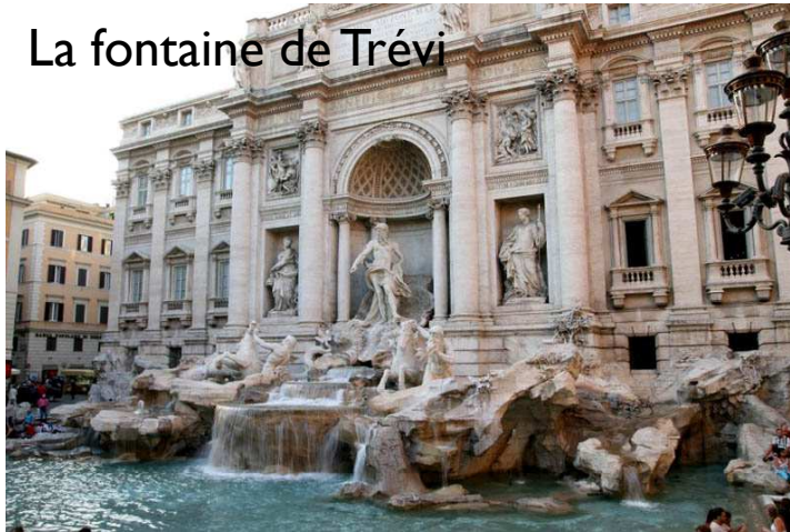
La fontaine de Trévi

Le matin, nous allons suivre une visite guidée de la Rome baroque. Nous passerons par la Piazza Cavour, la piazza Navona, la fontaine de Trévi .